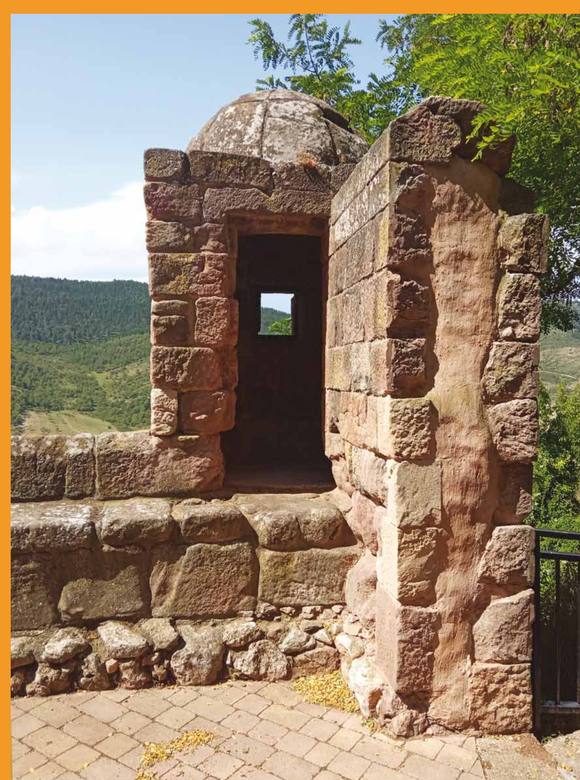
Muralla del siglo XIV