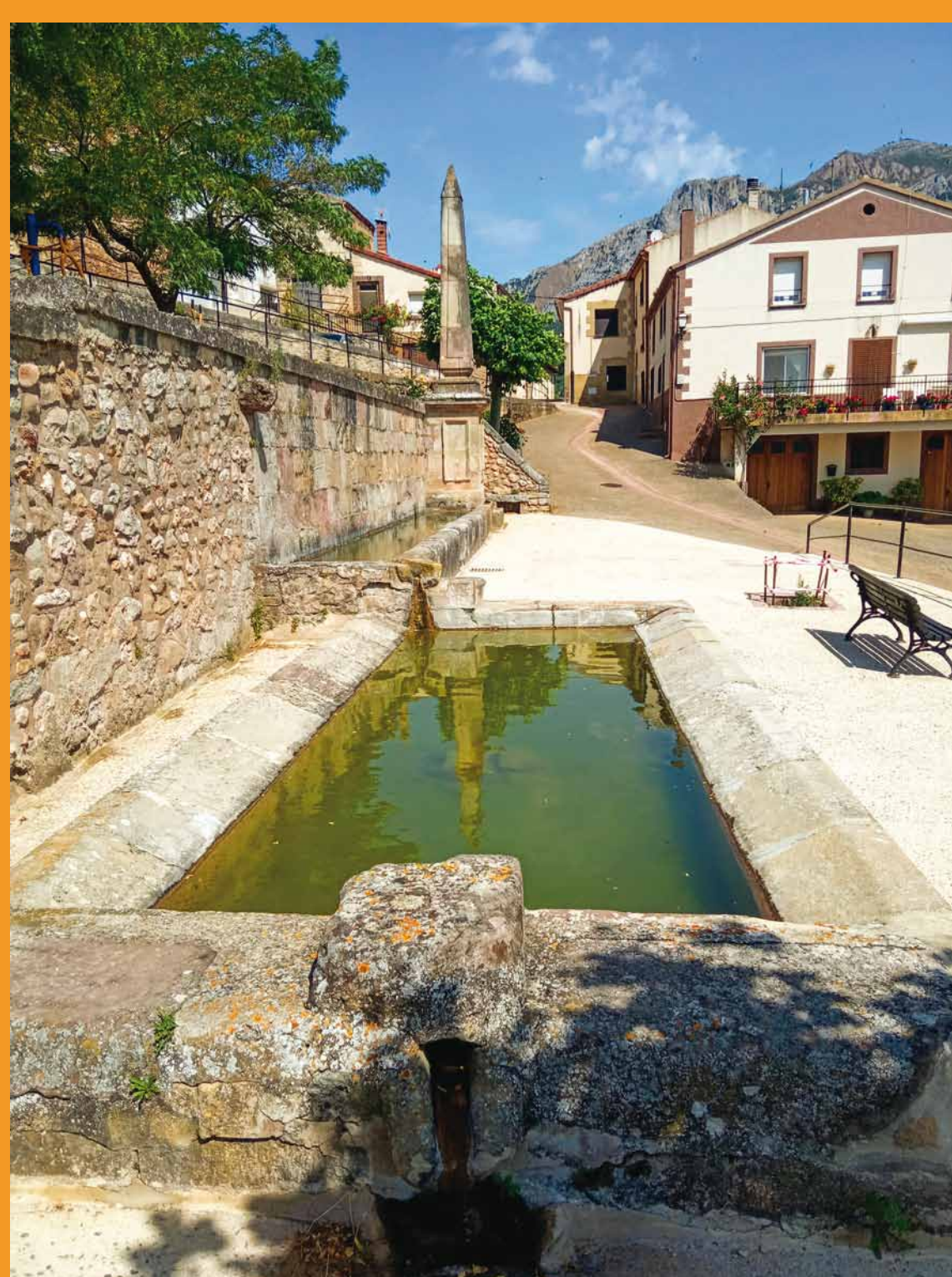
Fuente - abrevadero