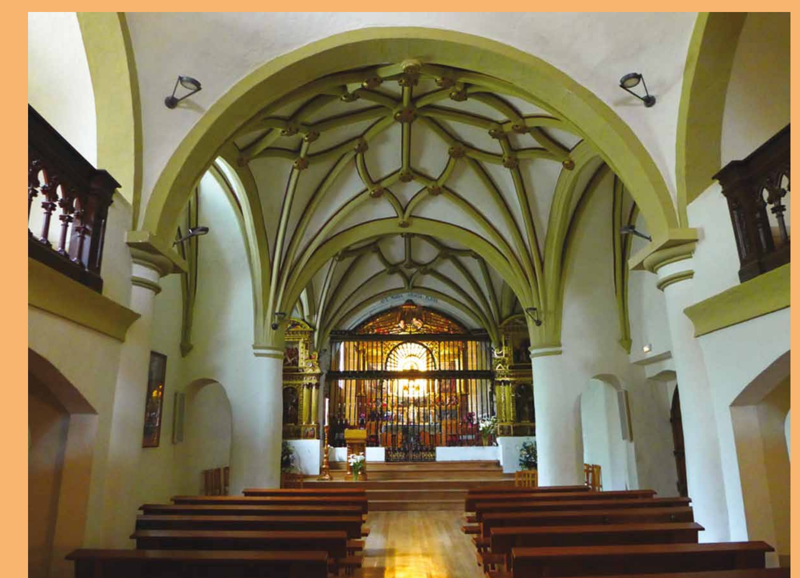
Interior del Santuario.