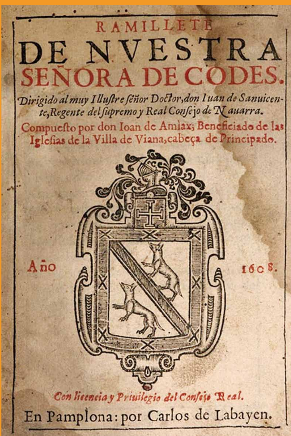
Imagen de la Virgen de Codés

Durante su estancia en la ermita se produjo otro hecho sorprendente: llevaron ante «Juan de Codés» a un chico de Torralba del Río que en una reyerta había sufrido una gravísima herida en el cuello. El ermitaño dijo misa, bendijo un paño, lo colocó en forma de cruz sobre la herida y el joven se curó milagrosamente.