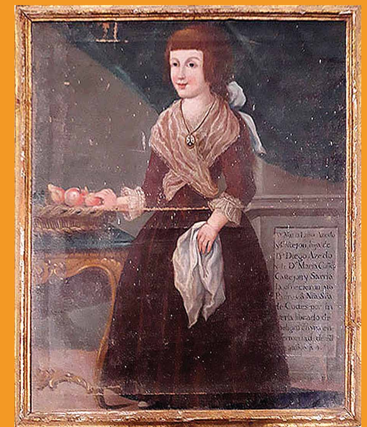
María Luisa Acedo y González de Castejón, librada del peligro de una enfermedad por la Virgen de Codés. Cuadro de 1.793 de Diego Díaz del Valle.